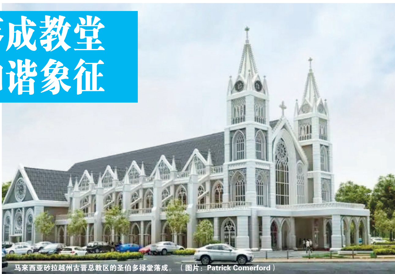
马来西亚砂拉越州古晋总教区的圣伯多禄堂落成。

他对砂拉越政府创建和支持的国营机构「其他宗教事务局」表示感谢，并将其形容为「对包容和跨宗教和平的