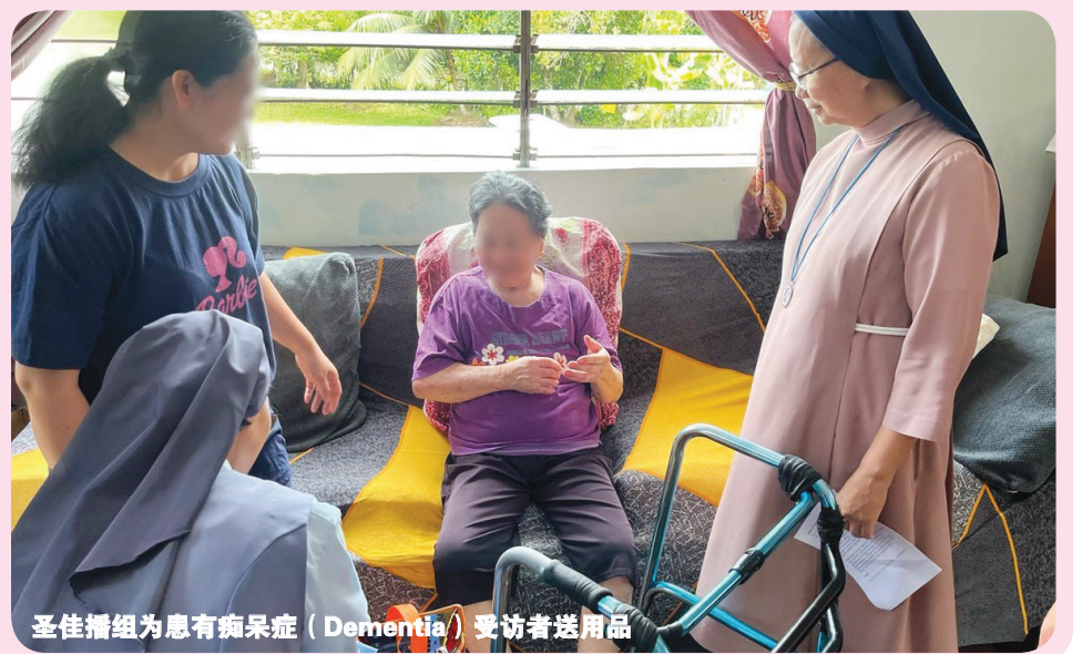
圣佳播组为患有痴呆症 (Dementia) 受访者送用品

物等；圣佳播天使组则于3月21日拜访特拉维的四位老人；而圣来福天使组则在3月26日探访科洛波斯3位中风卧床不起的家庭，给予他们心灵上的慰藉与关怀。 活动当天（3月21日），职员们不仅为受助者送上温暖的关怀，还带去了生活必需品，如米、面、粮油、成人尿布、清洁用品及一些小礼物，希望能够减轻他们的生活负担。这些物资不仅满足了他们的基本需求，更传递基督的爱与关怀，让受助者感受到教会的温暖与支持。 除了物资捐赠，职员们也透过歌唱赞美和祈祷，为受助者带来属灵上的慰藉，让他们感受到主的爱与他们同在。在这温馨的时刻，受助者们深受感动，感谢职员们的爱心与付出。 此次四旬期送暖活动在主的爱与感恩中圆满完成。 转载沙巴公教报/Catholic Sabah网站