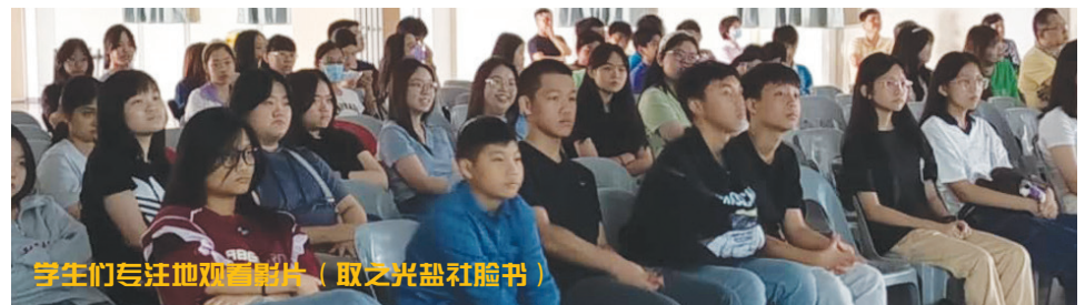
学生们专注地观看影片（取自光盐社脸书）

不是你们拣选了我，而是我拣选了你们，并派你们去结果实，去结常存的果实。(若十五16) 《在他乡的会士》聚焦三位来自马来西亚、长年于香港服务的会士，述说他们的信仰见证与人生旅程。节目于2023年拍摄，团队远赴香港展开为期一周的录制，于2024年中推出这系列充满信仰温度的故事。 首映在芥子福音传播中心举行后，影片也陆续上传至网络平台，与更广大的观众共享这份信仰的初果。 节目重温： https://www.youtube.com/playlist.. 学生们以纯真的眼神与回应为放映注入了惊喜与感动。愿这份在他乡的见证，能启发更多人聆听天主的召唤，在生活中结出常存的果实。 资料：光盐社脸书