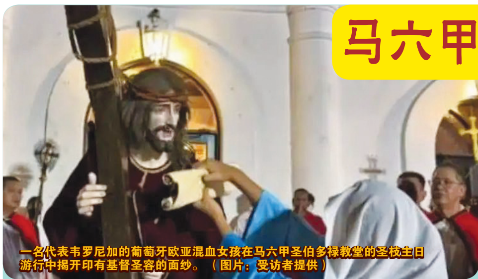
一名代表韦罗尼加的葡萄牙欧亚混血女孩在马六甲圣伯多禄教堂的圣枝主日游行中揭开印有基督圣容的面纱。

色。这不仅仅是一个普通的青年活动，更是改变人生的篇章。甜蜜的时刻如同糖一般，苦涩的时刻如同酸橙一般，但每一个时刻都塑造着我们。 当我们走出MiDYA时，我们确信一件事：我们已经不再是初来乍到时的我们了。