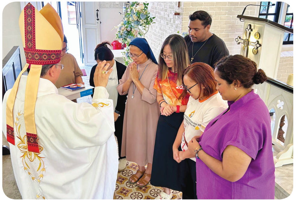
圣玛利亚堂，参与由傅云生总主教祭的弥撒。随后，代表团参观了蒙福青年培训中心，并听取了中心工作人

间，还进行了小组分享和个人反思。之后，傅总主教分享了“作为主的年轻门徒，如何聆听与辨别”来坚定青年牧者的信仰。为期一天的退省以伯纳德主教祭的弥撒结束，随后与来自马六甲-柔佛教区多个堂区的青年领袖共进晚餐。第三天以晨祷开始，随后举行全体会议。会议讨论了马来西亚和国际天主教青年的发展方向和项目等多项议题。本次会议的其中一个主要议题是解散2022-2025年度的国家协调办公室(NCO)的委员，并选出2025-2027年度的新一届的委员。下午会议结束后，代表们前往圣保禄山，与信众一起参加弥撒圣祭，纪念圣方济各·沙勿略抵达马六甲480周年暨圣方济各·沙勿略堂在马六甲成立180周年。圣保禄山是圣方济各·沙勿略在马六甲期间最喜欢祈祷和默想的地方。他逝世后，遗体曾安葬在这座教堂六个月，然后被送往印度果阿。弥撒结束后，代表们前往葡萄牙村共进晚餐，并与葡萄牙村的社群会面。第四天，代表们参观了马六甲的几个历史遗迹。代表团首先前往亚逸沙叻