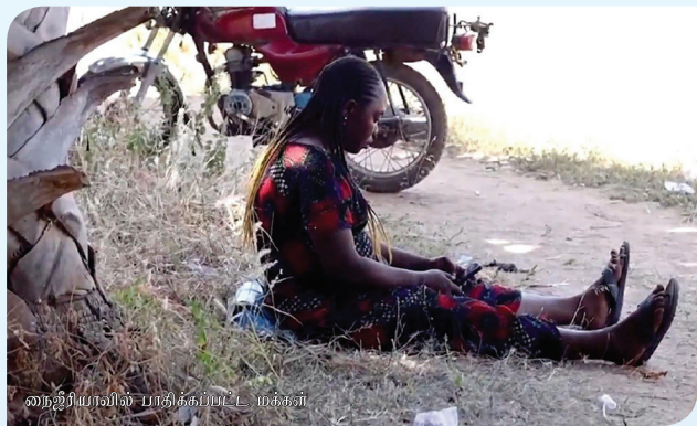
நைஜீரியாவில் பாதிக்கப்பட்ட மக்கள்

கடத்தல்காரர்கள் எருகுவில் உள்ள கிறிஸ்தவக் கோவில் ஒன்றில் நேரலையாக ஒளிபரப்பப்பட்ட இறைவேண்டலில் கலந்து கொண்ட 38 வழிபாட்டாளர்களைக் கடத்திச் சென்றனர்: பீதேஸ் செய்தி நிறுவனம்