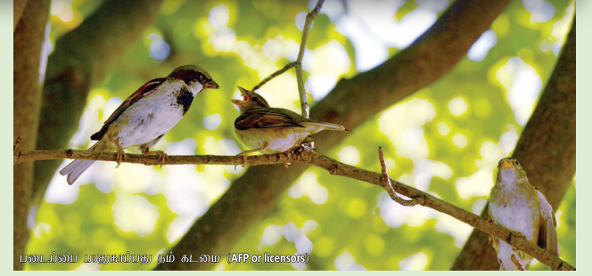
படைப்பை பாதுகாப்பது நம் கடமை

ஆண்டவர் இயேசுவால் படைக்கப்பட்டதும், மீட்கப்பட்டதுமான இந்த உலகை பாதுகாப்பது நம்பிக்கையான ஒவ்வொருவரின் கடமை என்றும், இயற்கை அழிவுகளாலும், மாசுபடுகின்றனாலும் பாதிக்கப்படுகின்ற சகோதர சகோதரிகளின் மீது அக்கறை கொண்டு படைப்பை பாதுகாப்பது நமது நம்பிக்கையும் மனிதநேயமும் ஆகும் என்றும் தெரிவித்துள்ளார் திருத்தந்தை.