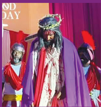
புனித ஆரோக்கியமாதா தேவாலயம், பாரிட் புந்தார்