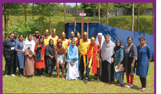
புனித பிரான்சிஸ் அசிசி தேவாலயம், செராஸ்