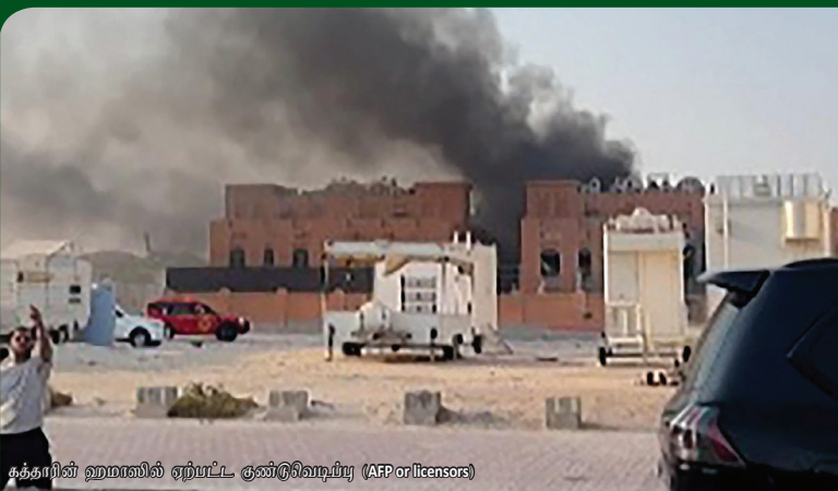
கத்தாரின் ஹமாஸில் ஏற்பட்ட குண்டு வெடிப்பு