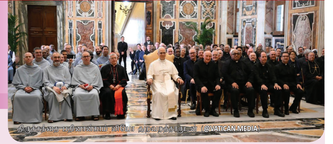
திருத்தந்தை பதினான்காம் லியோ தரவழிப்போட்டி

தரவழி வாழ்வில் சமூக வாழ்க்கையின் முக்கியத்துவம் தரம்மைப்படுத்தவுக்கான இடமாகவும், மறைபரப்பு ஆர்வம் மற்றும் ஆற்றலின் அடிப்படையாகவும் உள்ளது.