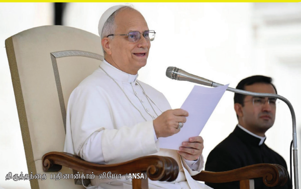
திருத்தந்தை பதினான்காம் லியோ

பேர்நிறுத்தம், பிணையக்கைகளை விடுவித்தல், பேச்சுவார்த்தை வழியாக இராஜதந்திர தீர்வு மற்றும் பன்னாட்டு மனிதாபிமான சட்டத்தை முழுமையாக மதிக்க வேண்டும் என்ற தனது வேண்டுகோளையும் புதுப்பித்த திருத்தந்தை அவர்கள், அமைதி மற்றும் நீதியின் விழயல் விரைவில் விழயடும் என்று எனது இதயப்பூர்வமான பிரார்த்தனையில் சேர அனைவருக்கும் அழைப்புவிடுத்தார்.