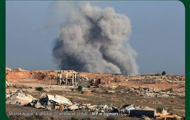
பேர்சு குழல் நிறைந்த இஸ்ரேயல் பகுதி

செப்டம்பர் 17, புதனன்று ஐக்கிய நாடுகள் அவையின் பன்னாட்டு விசாரணை ஆணையம் வெளியிட்டிருள்ள அறிக்கையில் இவ்வாறு தெரிவித்துள்ள நிலையில், காசாவில் செயல்படும் 20க்கும் மேற்பட்ட மனிதாபிமான அமைப்புகளை அவசர நடவடிக்கைக்கு அழைப்பு விடுத்துள்ளது அவ்வறிக்கை.