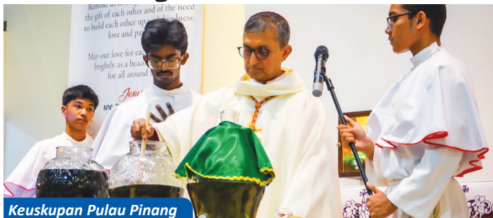
Keuskupan Pulau Pinang