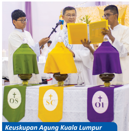
Keuskupan Agung Kuala Lumpur

Marilah kita berdoa untuk para paderi yang melalui saat-saat krisis dalam panggilan mereka, agar mereka dapat menemukan pendampingan yang mereka perlukan dan agar komuniti dapat menyokong mereka dengan pemahaman dan doa.