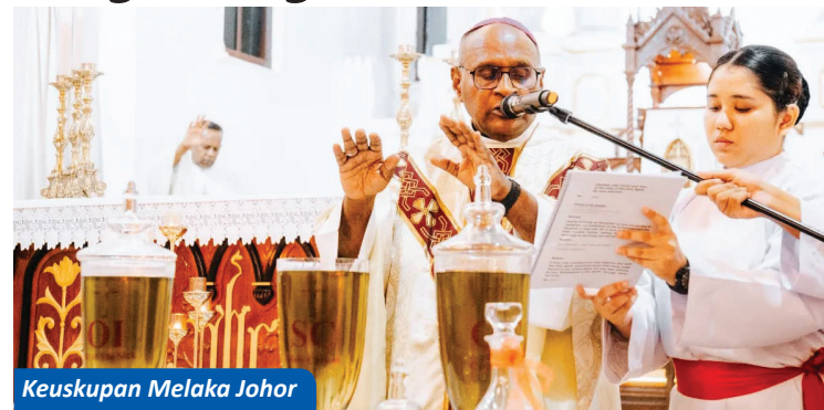
Keuskupan Melaka Johor