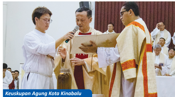
Keuskupan Agung Kota Kinabalu