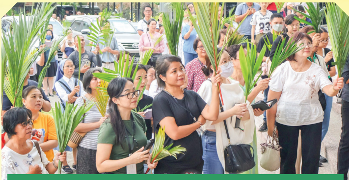
Langkah demi langkah, umat memasuki Katedral Hati Kudus, Kota Kinabalu, sambil melambai daun palma — simbol iman, harapan, dan kasih. Minggu Palma membuka jalan menuju Misteri Paskah.