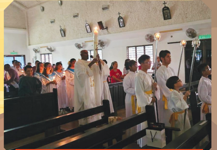
Perarakan masuk dengan lilin bercahaya pada malam vigil Paskah di Gereja Our Lady of Guadalupe, Melaka.

Semasa vigil Paskah, Uskup Julius Dusin Gitom membaptis para katekumen, melambangkan kematian terhadap dosa dan kebangkitan kepada hidup baru.