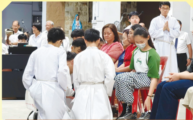
Belia dan wanita, antara yang terlibat dalam upacara pembasuhan kaki pada Hari Khamis Putih di Keuskupan Miri.