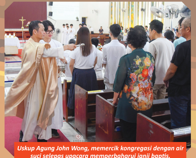
Uskup Agung John Wong, memercik kongregasi dengan air suci selepas upacara memperbaharui janji baptis.