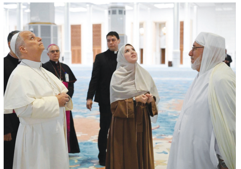
Sri Paus Leo di Masjid Agung Algiers

"Bersaksilah kepada Injil melalui isyarat sederhana, hubungan tulus dan dialog yang dijalani hari demi hari: dengan cara ini, anda membawa rasa dan cahaya ke tempat-tempat di mana anda tinggal," seru Sri Paus Leo.