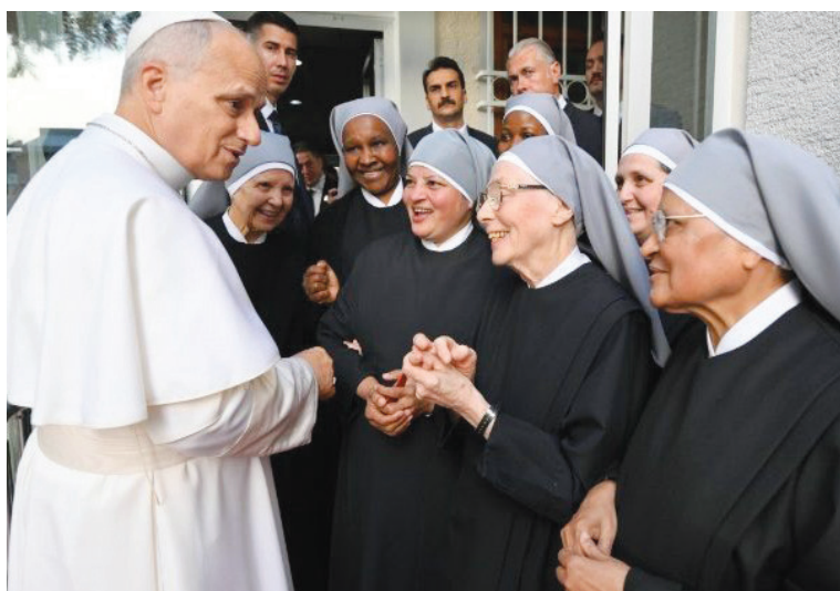
Sri Paus Leo XIV melawat rumah jagaan Little Sisters of the Poor di Annaba, Algeria, pada April 14, 2026.

Jawapannya adalah ya, ingatlah bahawa Tuhan, dengan kasih-Nya yang besar, menjadikan ini mungkin. Media Vatikan