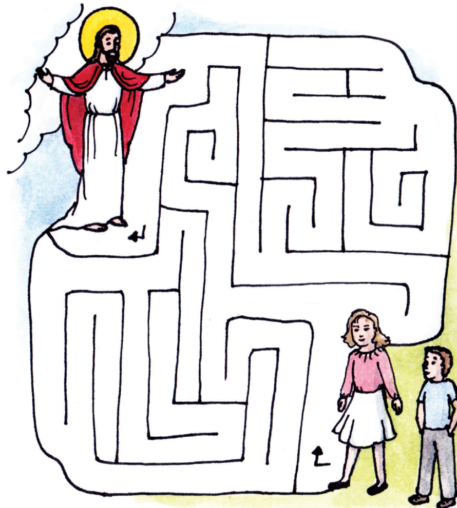
BANTU DUA ORANG KANAK-KANAK DALAM GAMBAR DI ATAS UNTUK BERTEMU DENGAN YESUS.