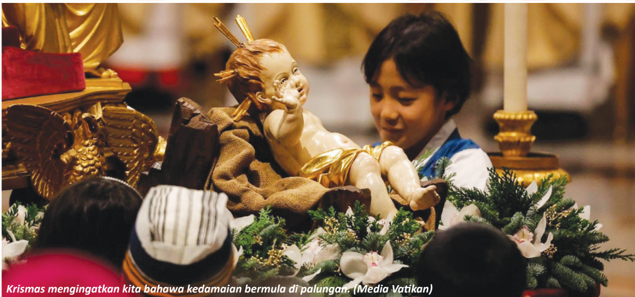
Krismas mengingatkan kita bahawa kedamaian bermula di palungan.