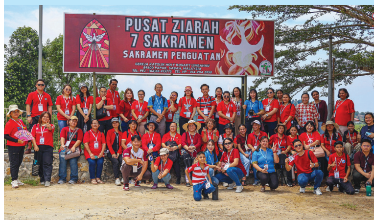
Umat SHC melakukan ziarah rohani Tujuh Sakramen di Limbahau dan Kinuta, Papar.