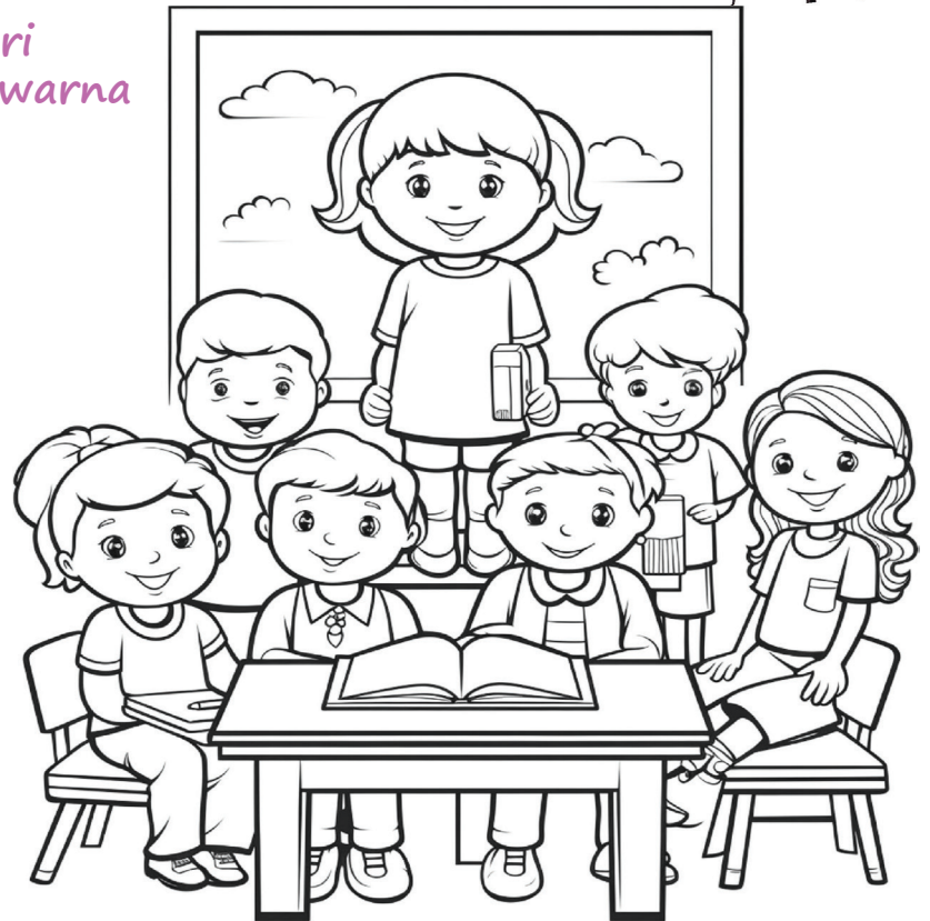
Berbahagialah orang yang membawa DAMAI, kerana mereka akan disebut anak-anak Tuhan (Mat 5:9).