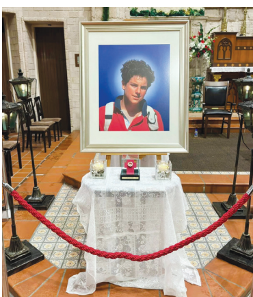
Berdukacita, Sri Paus Sto Yohanes Paulus II dan Sto Thomas Aquinas. Sto Carlo Acutis (1991–2006), yang dikanonisasikan pada tahun

Relik Sto Carlo Acutis kini menyertai koleksi berharga paroki termasuklah Sto Anthony dari Padua, Sta Thérèse dari Lisieux, Sto Francis Xavier, Sta Maria Goretti, Sto Jacques Chastan, Sta Faustina Kowalska, Sto Paulus dari Salib, Sto Gabriel dari Bonda Maria