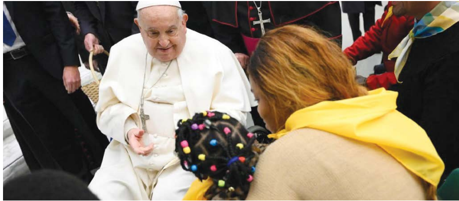
Sri Paus Fransiskus beramah mesra dengan para penziarah harapan sebelum dimasukkan ke hospital pada Februari 14, 2025.

Bapa Suci mengimbas kembali perjalanan tiga raja itu demi menemui Kristus, bahawa ketika para Majus itu memulakan perjalanan, bintang telah muncul dan