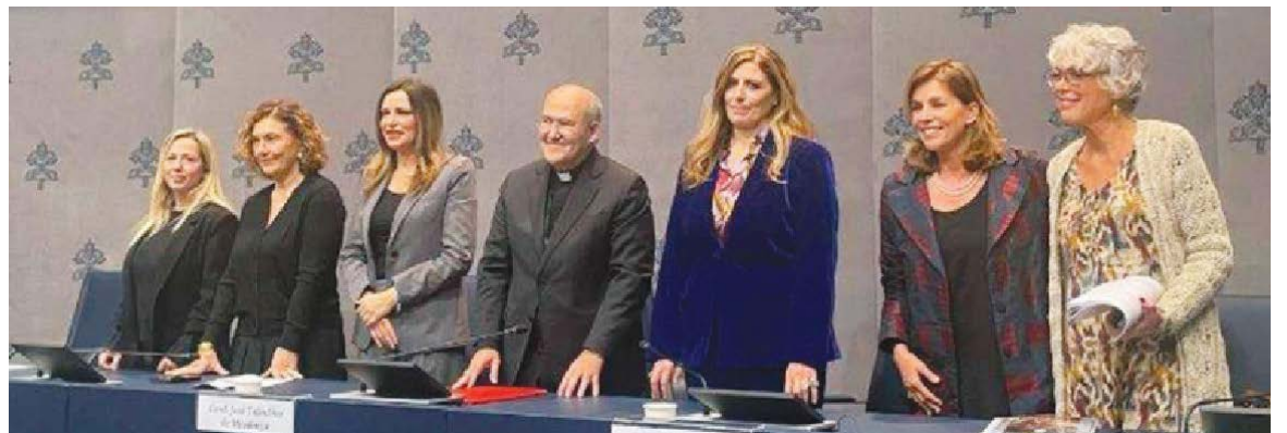
Sidang akhbar untuk acara Jubli para seniman.

Projek ini mengadakan inisiatif seperti Lentfest , iaitu perayaan ta-