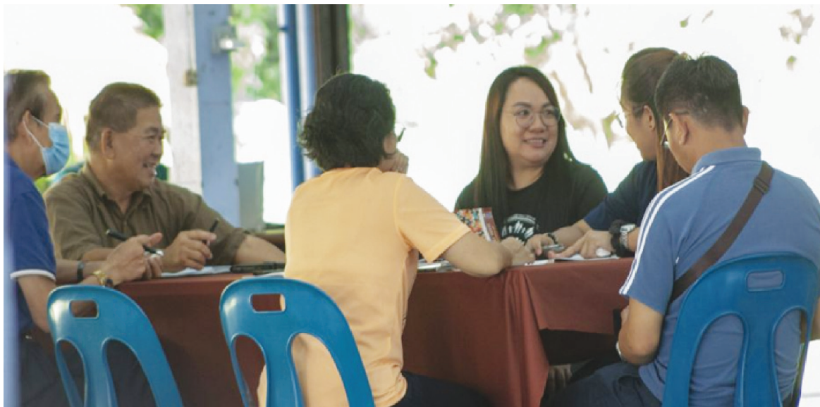
Mendiang Bapa Suci Fransiskus telah menggesa semua umat Katolik untuk menolak konflik, penguasaan, perpecahan, perang

Ensiklik itu mengingatkan umat beriman bahawa setiap orang Kristian dijemput untuk terus bertobat dan membantu membina dunia yang berakar umbi dalam harapan dan saling menghormati.