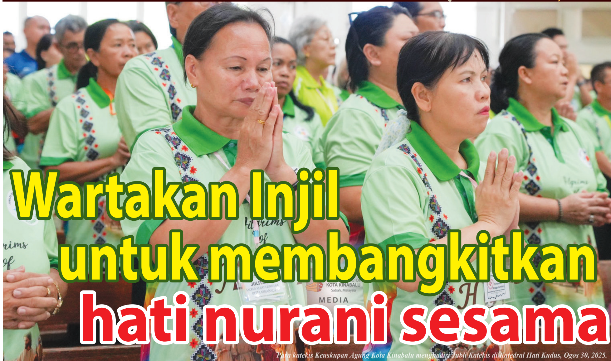
Pada katekis Keuskupan Agung Kota Kinabalu menghadiri Jubli Katekis di Katedral Hati Kudus, Ogos 30, 2025.

TAKHTA SUCI: Ketika para katekis mengajar, tujuan mereka bukan sekadar menyampaikan informasi tentang iman, tetapi “menempatkan sabda kehidupan di dalam hati, agar menghasilkan buah-buah kehidupan yang baik,” kata Sri Paus Leo XIV kepada lebih 20,000 orang katekis yang berada di Roma sempena Jubli Katekis pada September 26 hingga 28 lalu.