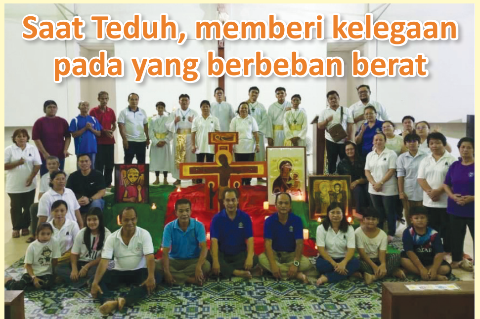
Saat Teduh, memberi kelegaan pada yang berbeban berat

Ketekunan mengikuti Saat Teduh dapat menumbuhkan budaya doa berterusan yang menjadi nadi kehidupan spiritual umat Katolik. Today's Catholic